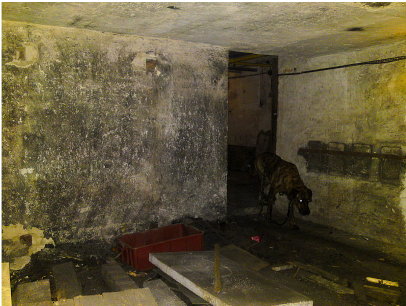
Zbytky briket, přívod plynu a vody